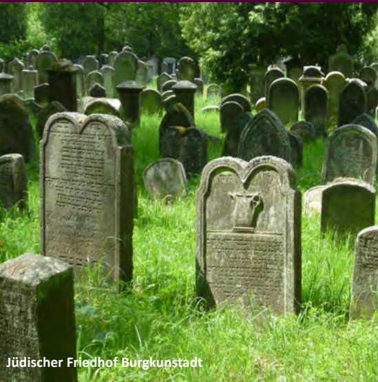
Jüdischer Friedhof Burgkunstadt