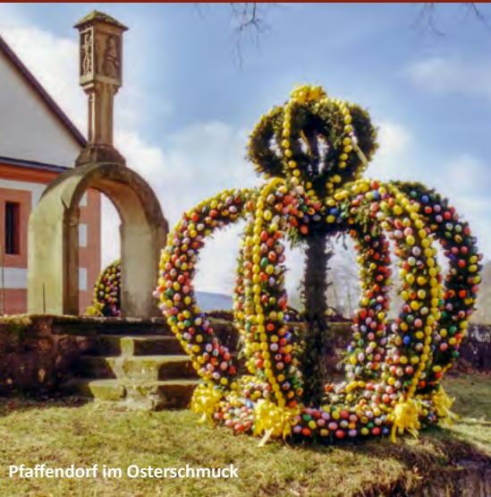
Pfaffendorf im Osterschmuck

Zur Osterzeit werden in vielen Orten die Osterbrunnen geschmückt.