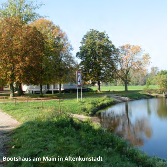
Bootshaus am Main in Altenkunstadt

Burgkunstadt, Altenkunstadt und Weismain liegen im Gottesgarten am Obermain, idyllisch im Norden Bayerns zwischen Fränkischer Schweiz und Frankenwald.