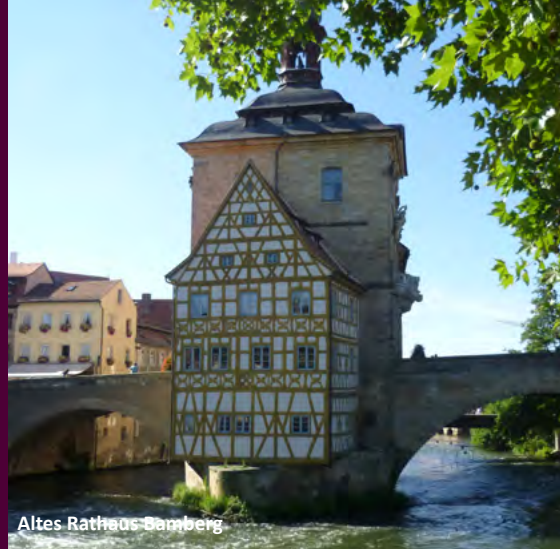
Altes Rathaus Bamberg