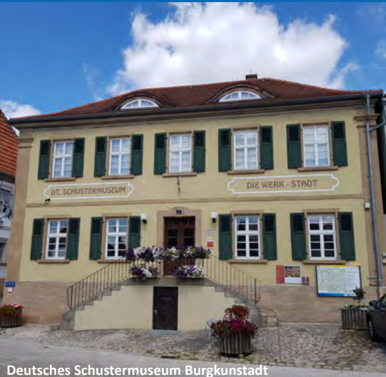
Deutsches Schustermuseum Burgkunstadt

Ein Muss in der näheren Umgebung: die Basilika Vierzehnheiligen und Kloster Banz!