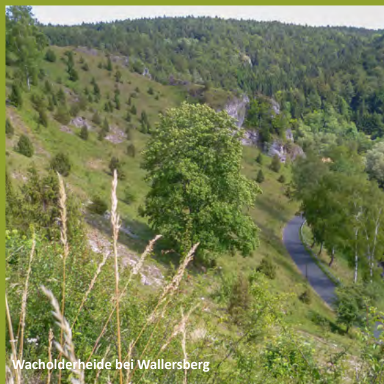
Wacholderheide bei Wallersberg