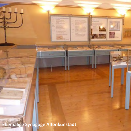
Ehemalige Synagoge Altenkunstadt