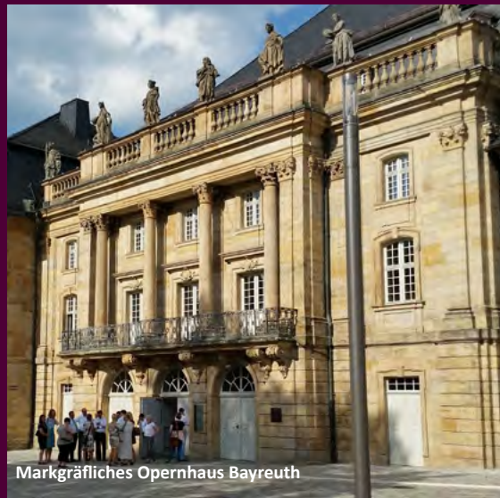
Markgräfliches Opernhaus Bayreuth