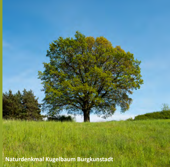
Naturdenkmal Kugelbaum Burgkunstadt