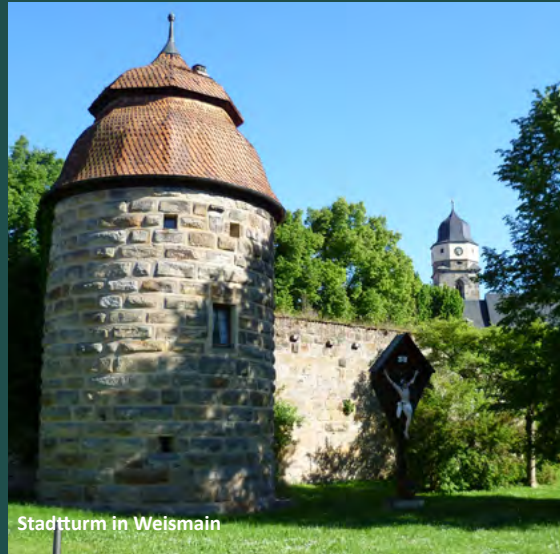
Stadtturm in Weismain