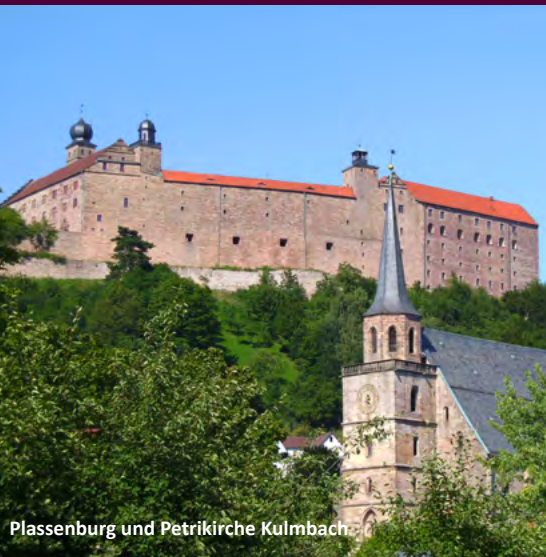
Plassenburg und Petrikerche Kulmbach