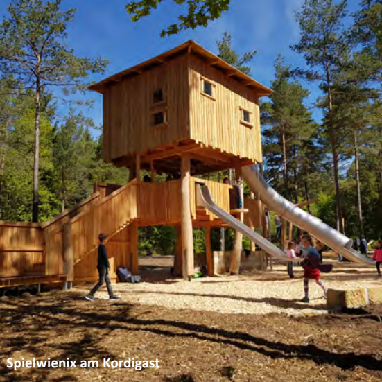
Spielwienix am Kordigast