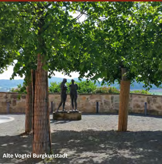
Alte Vogtei Burgkunstadt